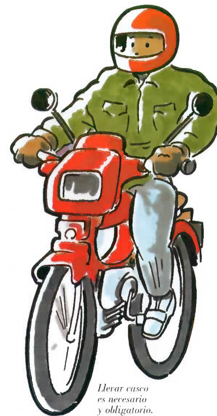
Llevar casco es necesario y obligatorio.

Si vuestro hijo va a montar en moto, tiene que llevar un casco homologado. Insistidle frecuentemente que el casco no se utiliza para evitar la multa, sino por seguridad.