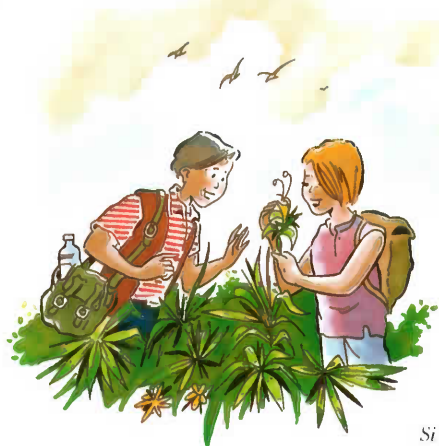
Si vuestro hijo conoce la naturaleza, aprenderá a respetarla y que existen ciertas plantas que no debe comer.

– El niño/a comienza a ir de excursión, con el colegio o con sus amigos, explicadle con ayuda de dibujos y láminas que existen plantas y setas de apariencias normales pero que son peligrosas para la salud y que no deben comerlas.