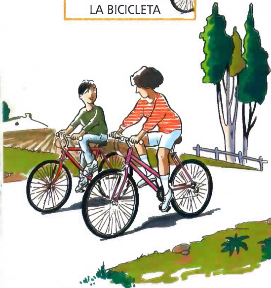
Los niños no deben circular por calles abiertas al tráfico si son menores.

– Querrá montar en bici con sus amigos; enseñadle que es peligroso y no necesario correr en exceso, ir metiéndose entre los coches, ir por calles prohibidas aunque sus amigos lo hagan.